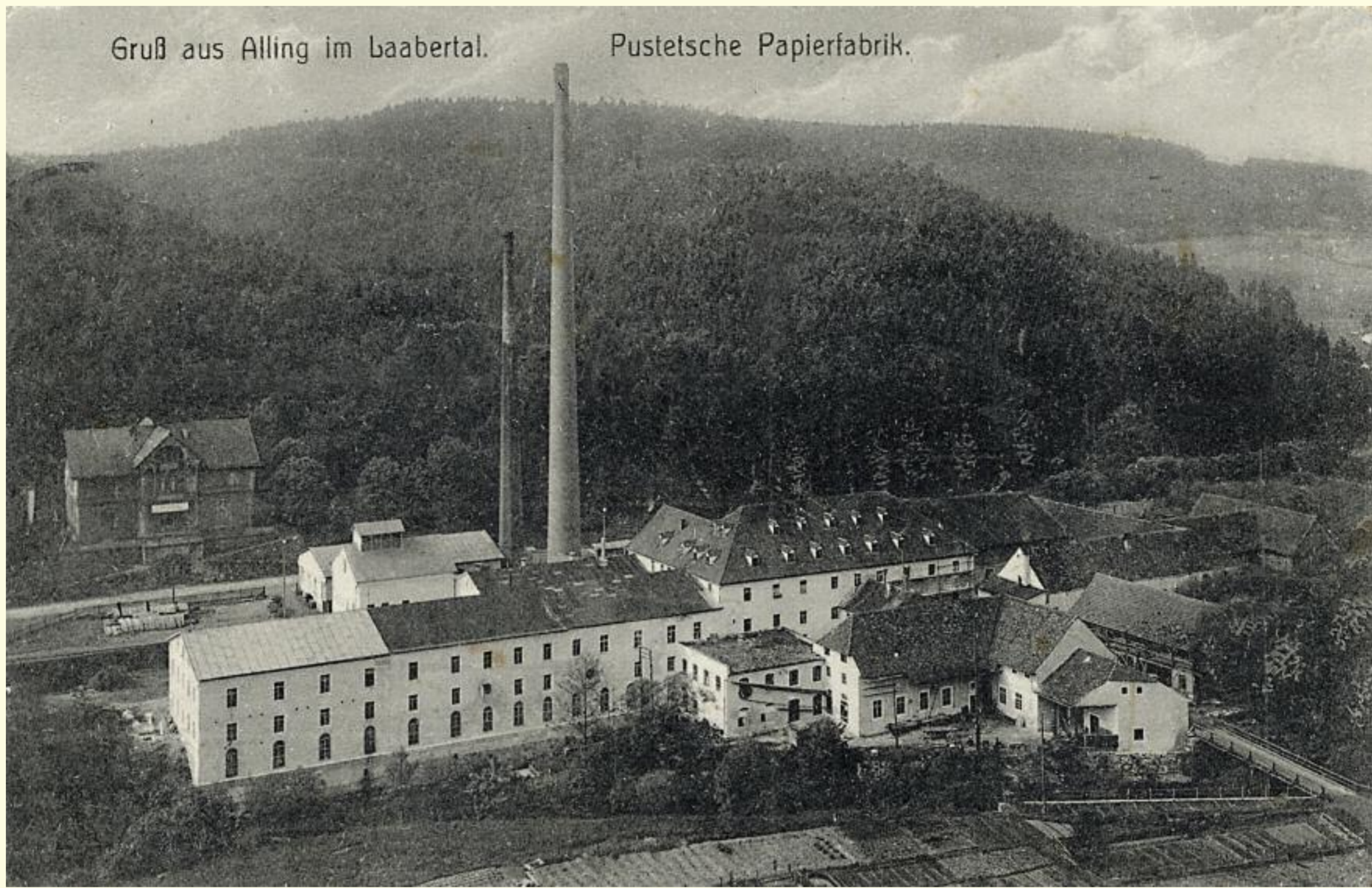
M7 – Historische Aufnahme um 1910