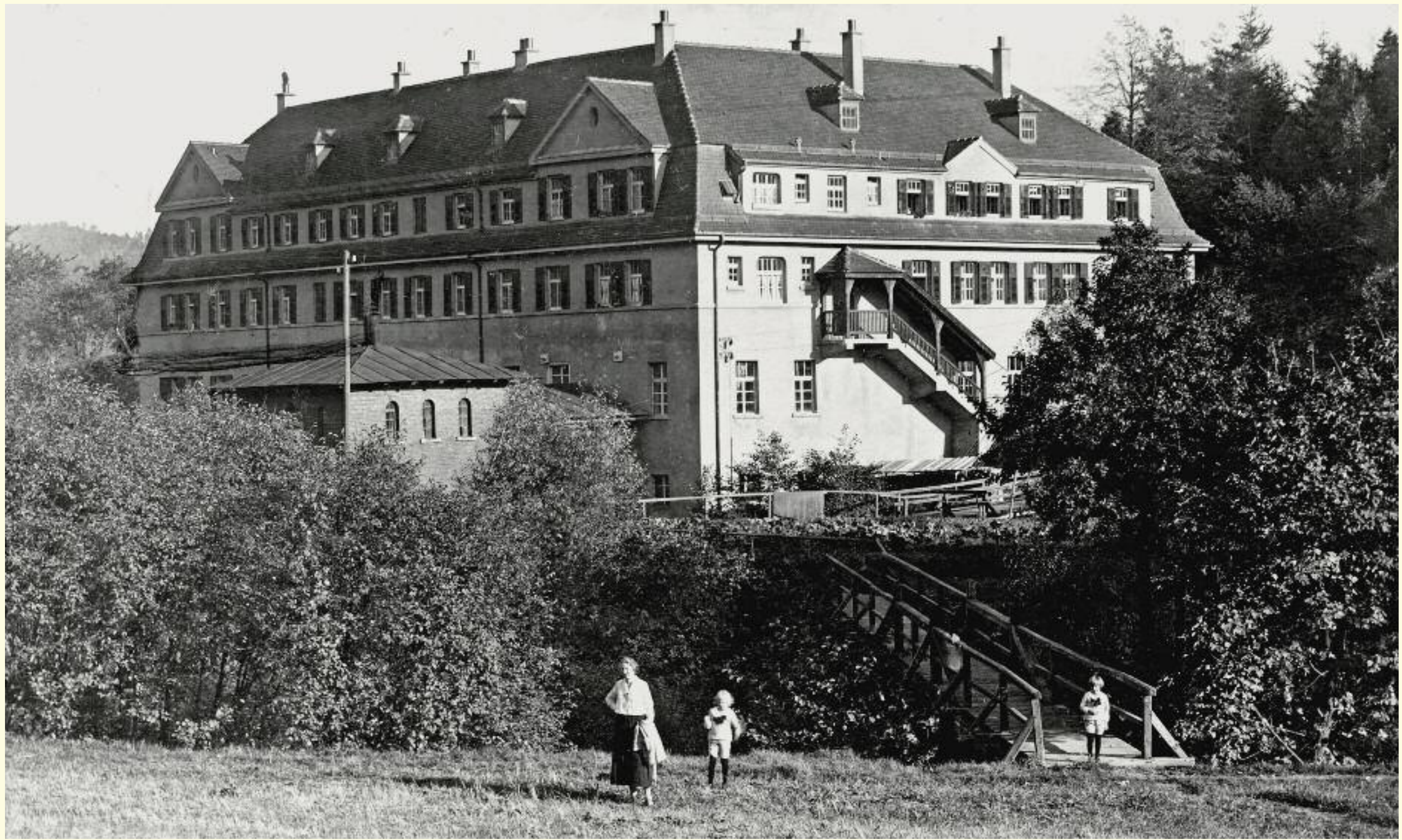
M6 – Historische Aufnahme um 1920